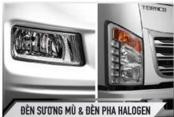
ĐÈN SƯƠNG MÙ & ĐÈN PHA HALOGEN