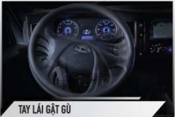
TAY LÁI GẬT GÙ

Trang bị tay lái gạt gù giúp bác tài điều chỉnh tay lái phù hợp với chiều cao và chiều dài tay của từng người.