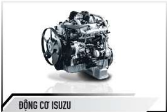
ĐỘNG CƠ ISUZU

Động cơ Diesel ISUZU mạnh mẽ, bền bỉ, tiết kiệm nhiên liệu, đạt tiêu chuẩn khí thải Euro5, thân thiện với môi trường.