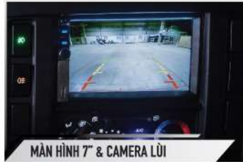
MÀN HÌNH 7" & CAMERA LÙI

Tăng sự thuận tiện cho bác tài và phụ lái với cửa số chỉnh điện lên xuống hiện đại.