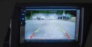
MÀN HÌNH 7" & CAMERA LÙI