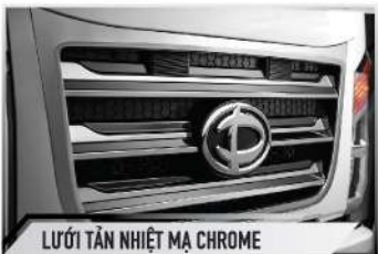
LƯỚI TẢN NHIỆT MẠ CHROME