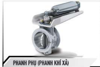
PHANH PHỤ (PHANH KHÍ XẢ)

Hộp số 5 cấp LC5T28 ưu việt, giúp xe tải vận hành, sang số chính xác và mượt mà.