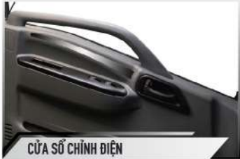
CỬA SỐ CHÍNH ĐIỆN

Trang bị tay lái gạt gù giúp bác tài điều chỉnh tay lái phù hợp với chiều cao và chiều dài tay của từng người.