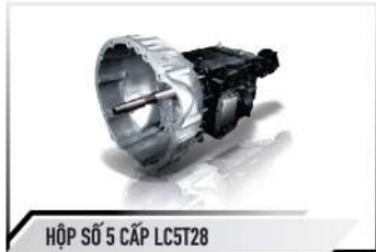
HỘP SỐ 5 CẤP LC5T28

Động cơ Diesel ISUZU mạnh mẽ, bền bỉ, tiết kiệm nhiên liệu, đạt tiêu chuẩn khí thải Euro5, thân thiện với môi trường.