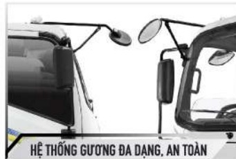
HỆ THỐNG GƯƠNG ĐA DẠNG, AN TOÀN