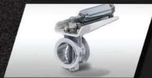
PHANH PHỤ (PHANH KHÍ XẢ)