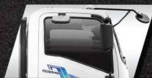
CỬA SỐ CHỈNH ĐIỆN